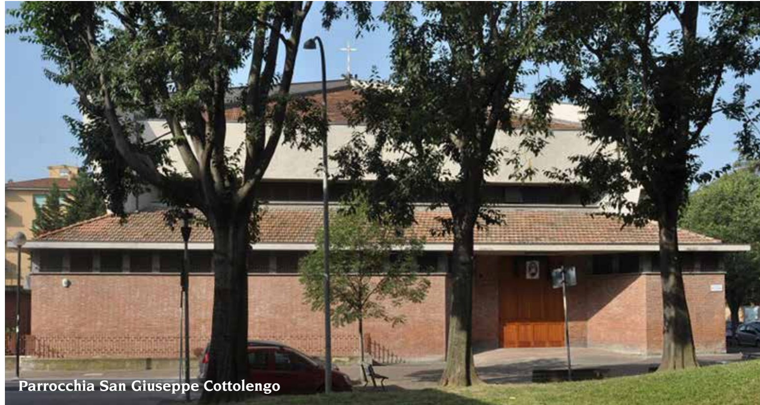
Parrocchia San Giuseppe Cottolengo