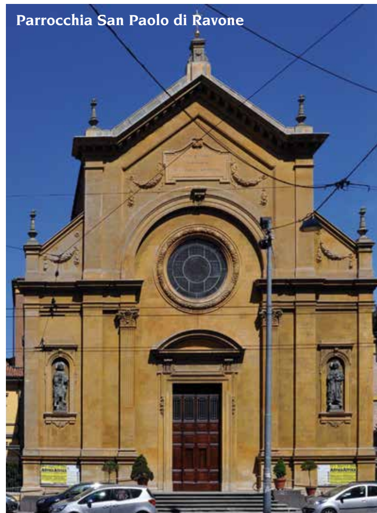
Parrocchia San Paolo di Ravone