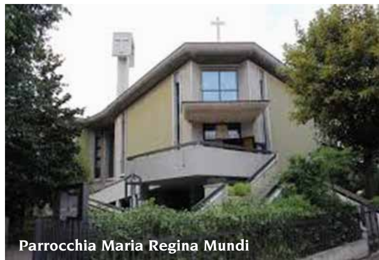
Parrocchia Maria Regina Mundi