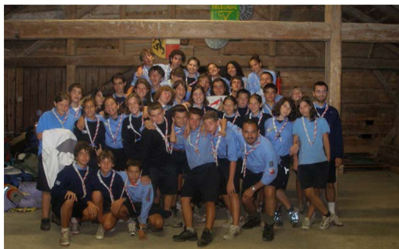
Campo di reparto «Robin Hood»

Dopo ben sei anni che il Reparto Sirio - La Strada non toccava terra straniera, finalmente quest'estate si è potuto realizzare un Campo Estivo in Austria, nella base scout di Zellhof!