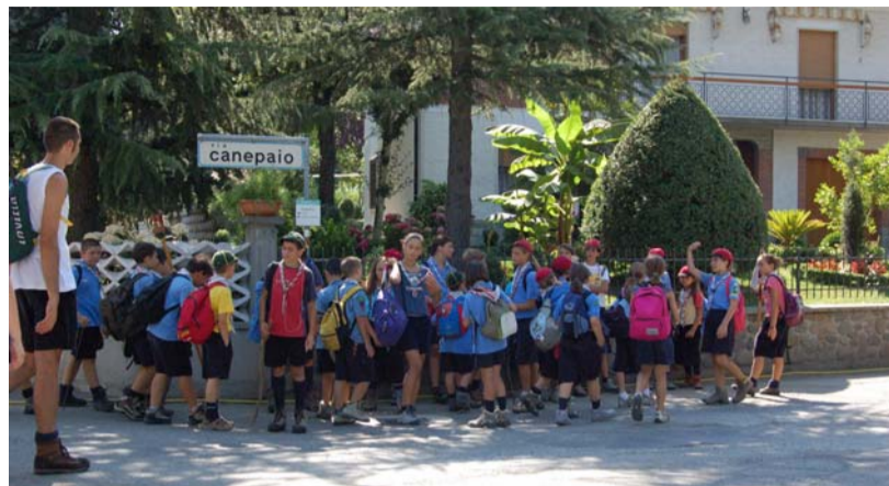
Vacanze di Branco e di Cerchio «I tre moschettieri»

È volato un anno intero ed eccoci subito all'inizio di uno nuovo. L'estate ha visto i lupetti e le coccinelle protagonisti delle VdBC (vacanze di Branco e di Cerchio), svoltesi dal 25 luglio al 1° agosto, nuovamente in località Gainazzo di Guiglia (MO). Abbiamo trascorso la settimana all'insegna di giochi e attività scout, sulle orme delle avventure del celebre romanzo di Dumas «I tre moschettieri». Tra misteriosi complotti e continui colpi di scena abbiamo seguito le avventure di D'Artagnan, difeso la vita del Re di Francia e sventato ogni complotto alle spalle della Corona Reale, per poter finalmente festeggiare la riunione del corpo dei moschettieri! La settimana è stata intensa tra giochi d'acqua, caccia/volo, gioco notturno e l'immane ispezione... ma ci ha permesso di intensificare e solidificare tutto quello che abbiamo costruito durante l'anno e imparare a vivere davvero ispirati alla legge che promettiamo di rispettare, da veri lupetti e coccinelle: vivere con gioia e lealtà insieme al Branco e al Cerchio, con le difficoltà e le bellezze che questo comporta. Riassumere tutto in qualche riga è difficile e i ricordi più belli sono sicuramente quelli che portiamo nel nostro cuore però vi lasciamo qualche foto per condividere con le immagini parte delle nostre giornate.