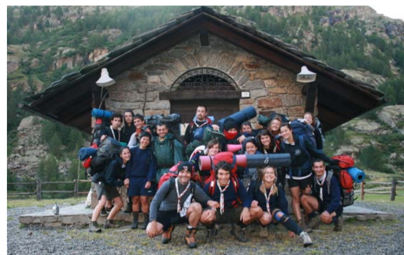
Route estiva sul Gran Paradiso «Viaggio al centro di me stesso»